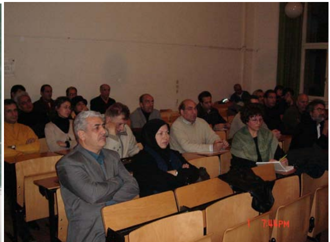
گردهمایی اول دسامبر در دانشگاه فنی برلین