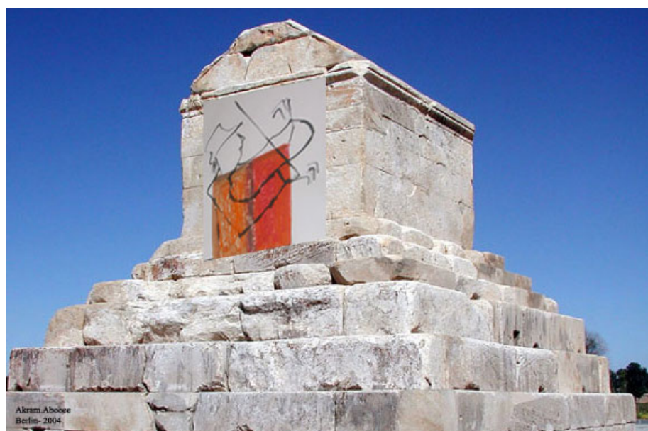
«هنر از خاک»، کلاژ عکس و نقاشی، از اکرم ابوبنی

امضاء کنندگان گرامی نامه سرگشاده برای حفظ آثار دشت پاسارگاد! و مردم علاقمند به میراث فرهنگی بشری!