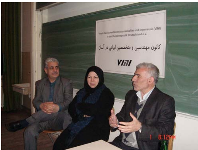
سخنرانان نشست اول دسامبر در دانشگاه برلین