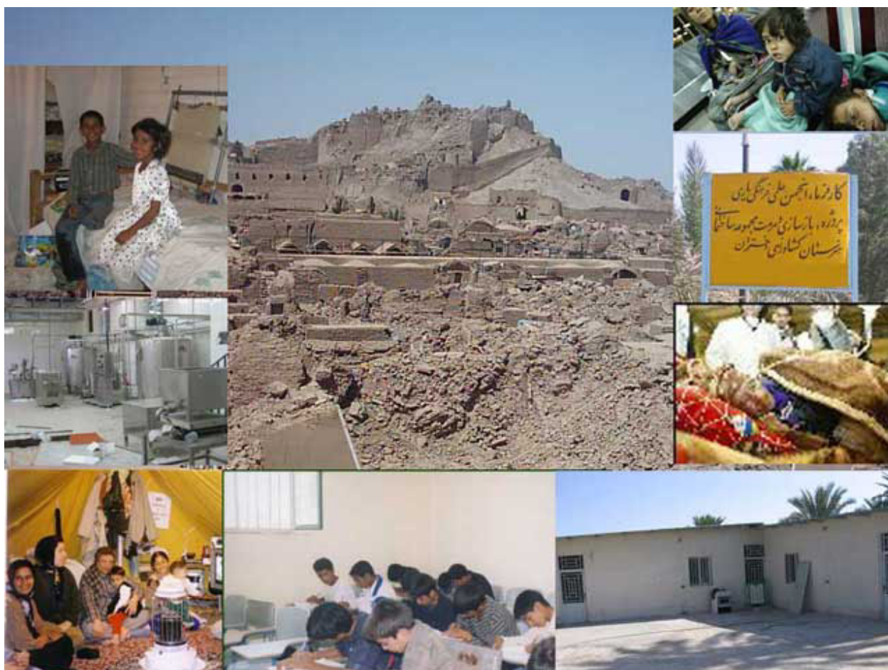
گوشه‌ای از فعالیت‌های کمک‌رسانی مردم برای بازسازی شهر بم

آدرس "وب سایت" مربوط به این فعالیت‌ها که بر روی سایت کانون هم قابل دسترسی علاقمندان است، به شرح زیر می‌باشد: